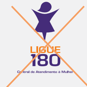
Alteração de elementos da marca