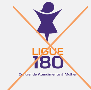
Alteração de elementos da marca