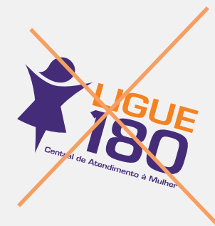
Rotacionar a marca