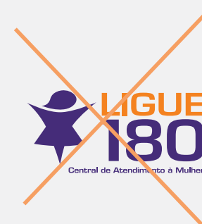
Distorção no símbolo