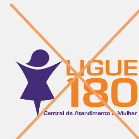
Alteração da cor