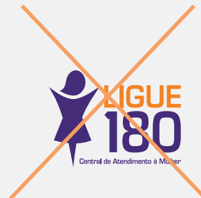
Distorção na marca

A marca não deve ser alterada, seja nas suas cores, diagramação ou proporções. Ao lado figuram alguns erros que podem ocorrer. Comparando com a marca original, verifique os usos incorretos e se assegure de que a marca Ligue 180 nunca seja alterada.