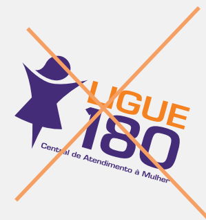
Rotacionar a marca